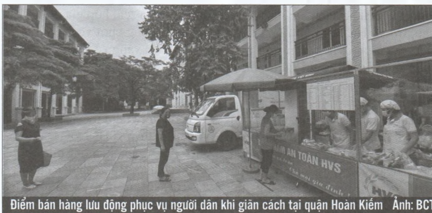
Điểm bán hàng lưu động phục vụ người dân khi giãn cách tại quận Hoàn Kiếm

Theo số liệu từ 5 DN bưu chính, tính đến hết ngày 7/8, tổng khối lượng hàng hóa thiết yếu đã cung ứng tới người dân các địa phương trên cả nước là 14.584 tấn với giá trị 448,43 tỷ đồng. Đồng thời, đã thiết lập 3.735 điểm cung cấp hàng hóa thiết yếu cho người dân các tỉnh, TP đang giãn cách. Hiện nay, cùng với việc đảm bảo duy trì chuỗi cung ứng hàng hóa tại Hà Nội trong thời gian thực hiện giãn cách, các DN bưu chính đang tập trung vừa đảm bảo cung ứng hàng hóa thiết yếu, vừa hỗ trợ tiêu thụ nông sản đến kỳ thu hoạch tại 19 tỉnh, thành phía Nam như: An Giang, Bà Rịa - Vũng Tàu, Bến Tre, Bình Dương, Bình Phước, Cà Mau, Cần Thơ, Đồng Nai, Đồng Tháp, Hậu Giang, Kiên Giang, Long An, Sóc Trăng, Tây Ninh, Tiền Giang, TP HCM, Trà Vinh, Vĩnh Long và Bạc Liêu. Bộ Công thương cho biết, thời gian tới, mô hình này sẽ được xác định là một trong những kênh phân phối chính, phát huy tối đa hiệu quả, nhằm cung ứng hàng hóa đến cho người dân các địa phương còn thực hiện giãn cách xã hội ■