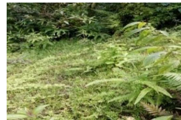
Trảng cỏ thứ sinh