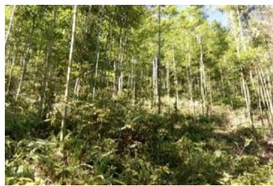
Rừng tre luồng