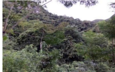
Rừng thứ sinh