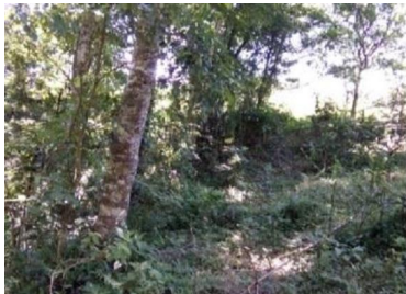
Trảng cây bụi xen cây gỗ thứ sinh