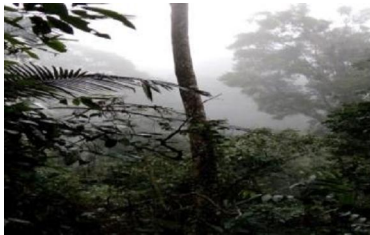
Rừng nguyên sinh

Lập tuyến và điểm điều tra: Khu vực nghiên cứu có 6 dạng sinh cảnh chính: rừng nguyên sinh (SC1), rừng thứ sinh (SC2), trảng cỏ thứ sinh (SC3), trảng cây bụi xen cây gỗ thứ sinh (SC4), rừng tre luồng (SC5), sinh cảnh quanh bản làng và nương rẫy (SC6). 5 tuyến điều tra được lập qua các dạng sinh cảnh khác nhau, trên tuyến tại mỗi sinh cảnh lập một điểm điều tra diện tích 500 m 2 .