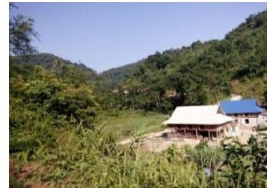
Quanh bản làng và nương rẫy