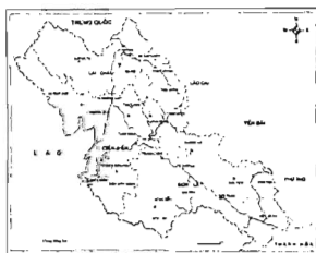
Hình 1. Vị trí khu vực nghiên cứu

- Bản đồ địa hình và bản đồ hành chính tỉnh Sơn La, Lai Châu, Điện Biên tỷ lệ 1: 50.000 gồm đường bình độ, các điểm độ cao và địa danh. Mô hình số độ cao với độ phân giải 30 x 30 m. Bản đồ địa hình cao 100 m, cơ sở phân loại các kiểu địa hình. Phần mềm Mapinfo 12.0 và Arc GIS 10.5 được sử dụng để xây dựng các bản đồ chuyên đề, phân tích, thống kê, tính toán các chỉ số hình học, diện tích của các kiểu địa hình và mối quan hệ của chúng với các thành phần tự nhiên khác.