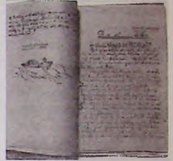
● Cuốn sách "Đường Kách Mệnh" hiện được lưu giữ tại Bảo tàng Lịch sử Quốc gia.