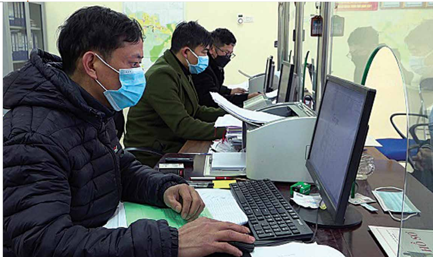
Cán bộ, công chức xã Tú Lệ tích cực ứng dụng các tài khoản điện tử vào hoạt động.

đạo cán bộ, công chức xã Tú Lệ để kịp thời thông tin, trao đổi công việc liên quan quá trình triển khai thí điểm.