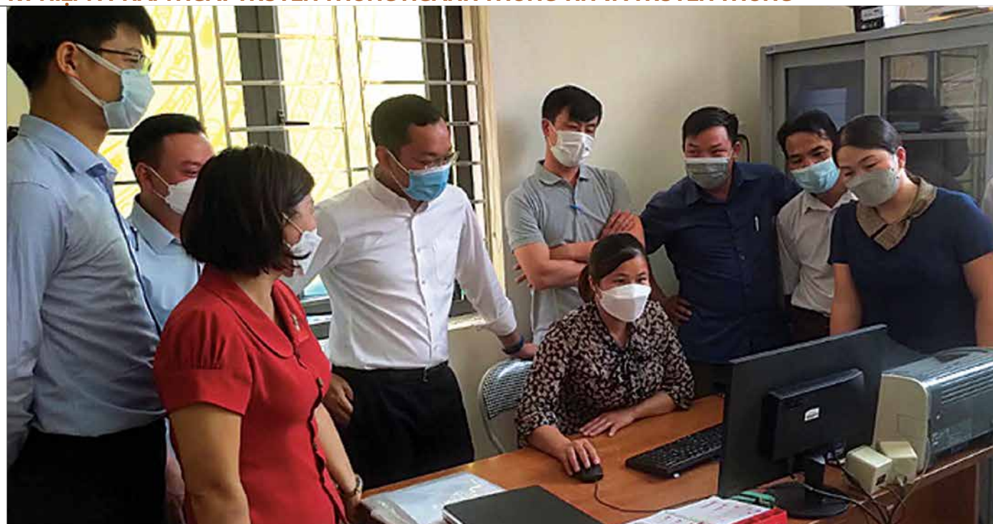
Lãnh đạo Sở Thông tin và Truyền thông tỉnh kiểm tra mô hình chuyển đổi số tại xã Tú Lệ, huyện Văn Chấn.