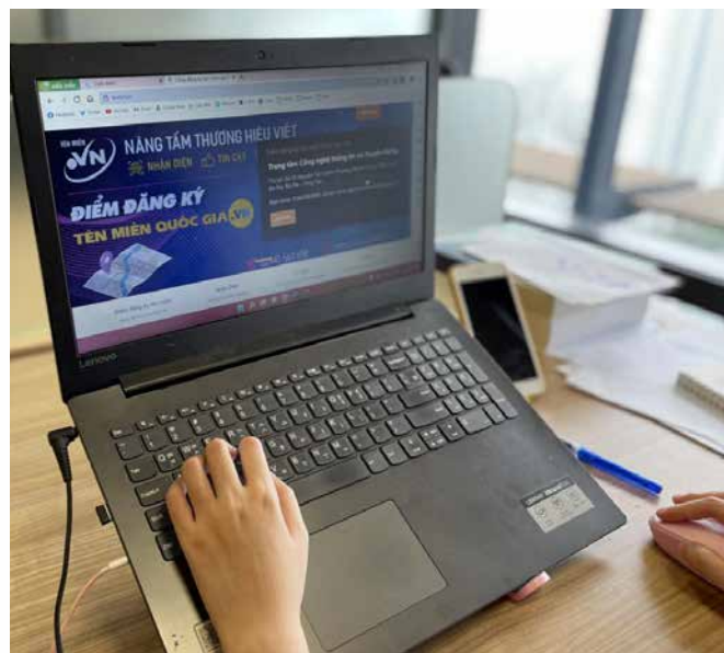
Hình 2: Điểm đăng ký tên miền “.vn” tỉnh Bà Rịa - Vũng Tàu vừa được khai trương tại địa chỉ brvtict.vn

Trong năm 2021, VNNIC đã phối hợp với các Sở TTTT và các ĐNK tên miền “.vn” triển khai nhiều hoạt động cụ thể tại từng địa phương, bắt đầu với chương trình khai trương điểm đăng ký và cổng đăng ký online tên miền quốc gia “.vn”. Tính đến tháng 5/2022, chương trình đã được triển khai tại 06 địa phương: Đồng Tháp ( https://dtict.vn/ ), Vĩnh Long ( https://vlct.vn/ ), Hậu Giang ( https://haugiangict.vn/ ), Thái Nguyên ( https://tnict.vn/ ), Bà Rịa – Vũng Tàu ( brvtict.vn/ ), Lâm Đồng ( https://lamdongict.vn/ ).