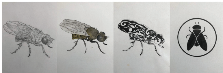
Hình 4. Bài nghiên cứu, cách điệu côn trùng của SV. Vương Thị Hải Yến - Khoa MTCN&KT, Trường Đại học Hòa Bình

Cách điệu theo cấu trúc: do yêu cầu phải có một loại mô típ hết sức cô đọng, giản đơn, có tính tượng trưng cao thì phải theo cách điệu lối này. Ví dụ: tộc huy, gia huy, quốc huy, biểu trưng của các hãng... Cũng có thể đó là những mô đun trang trí kiến trúc, gạch thông gió, chạm khắc đá, kim loại. Thực ra, giữa hai hình thức này không có ranh giới tuyệt đối mà trong nhiều tác phẩm, nhiều mô típ trang trí vẫn có sự giao thoa để phù hợp với những cung bậc khác nhau giữa cấu trúc và tự nhiên, giữa cảm xúc và trí tuệ.