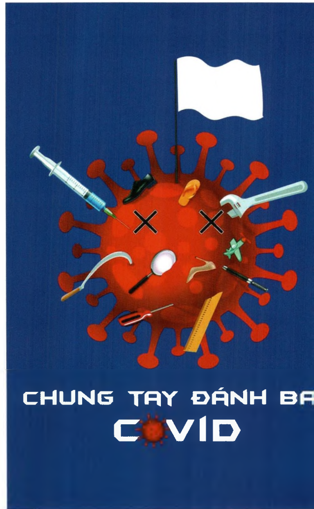
Ảnh 3. Sinh viên Khoa Mỹ thuật ứng dụng đoạt Giải nhì Cuộc thi “Chung tay đánh bay covid”

Khoa Mỹ thuật ứng dụng cũng bám sát chủ trương đổi mới của nhà trường để điều chỉnh khối lượng kiến thức trong chương trình đào tạo theo hướng tăng cường kiến thức chuyên môn trong thực tế, giảm bớt các kiến thức lý thuyết, hàn lâm. Trang bị cho người học kiến thức, kỹ năng sử dụng và làm chủ phần mềm thiết kế đồ họa cơ bản, làm công cụ hỗ trợ việc thể hiện ý tưởng sáng tạo. Bên cạnh đó, tổ chức kết nối các công ty, doanh nghiệp tham gia hội thảo chuyên đề cùng trao đổi, góp ý và chia sẻ về kỹ năng cần có, hiểu được tiêu chí, yêu cầu tuyển dụng của mỗi công ty. Ngoài ra, doanh nghiệp còn góp ý xây dựng các chương trình liên kết thực tập, thực hành, đầu tư trang thiết bị công nghệ trong đào tạo.