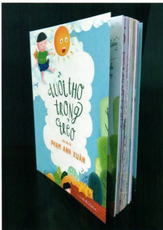
Ảnh 2. Sinh viên Khoa Mỹ thuật ứng dụng minh họa thực tế cho Nhà sách Đông A

Thứ hai là đào tạo chính quy. Các trường đào tạo chính quy (đại học, cao đẳng) về ngành thiết kế đồ họa hiện nay có thời gian đào tạo dài, chú trọng vào việc đào tạo sâu về kiến thức mỹ thuật, ý tưởng sáng tạo. Một số trường chưa chú trọng đúng mức tới khâu đầu tư, gắn kết thực hành, thậm chí không đào tạo kỹ năng sử dụng công cụ, phần mềm thiết kế và rèn luyện kỹ năng thực hành. Kết quả là, sinh viên ra trường tuy có kiến thức mỹ thuật vững, khả năng sáng tạo tốt, nhưng bị hạn chế ở các kỹ năng sử dụng công cụ thể hiện. Điều này dẫn đến tình trạng sinh viên tốt nghiệp khó thể hiện tốt ý tưởng sáng tạo của mình, hoặc thiếu kiến thức thực tế, hạn chế cơ hội làm việc trong môi trường cạnh tranh.