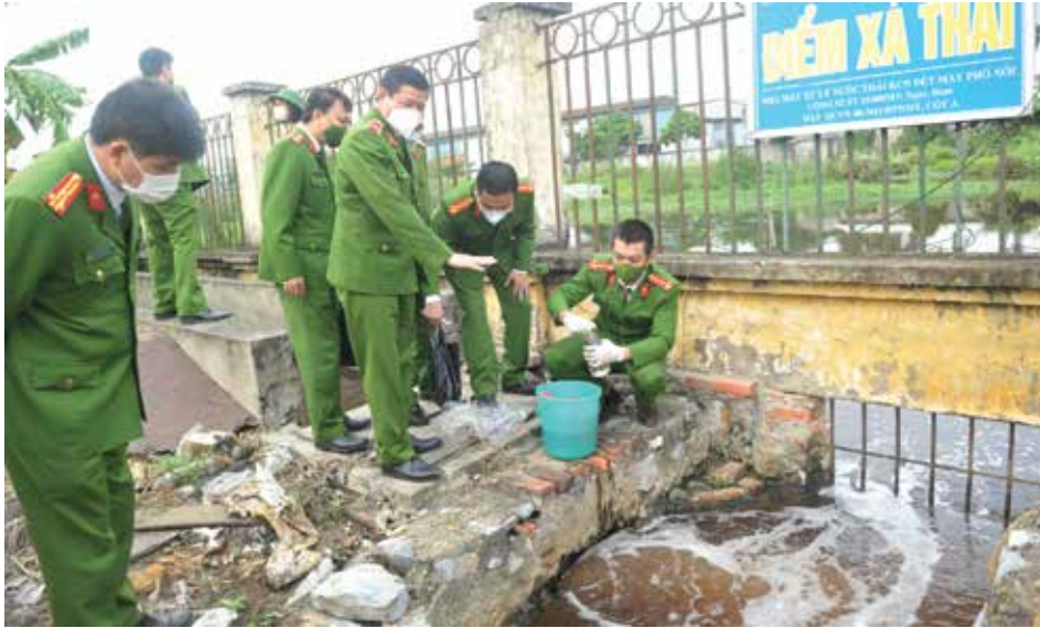
▲ Đơn vị nghiệp vụ của Cục Cảnh sát PCTP về môi trường kiểm tra, thu mẫu nước thải của một số doanh nghiệp trên địa bàn tỉnh Hưng Yên, ngày 25/11/2021

bảo ANTT, an toàn xã hội (ATXH) trong lĩnh vực BVMT, tài nguyên, ATTP. Đây cũng là lực lượng tiên phong phối hợp chặt chẽ với các lực lượng chức năng liên quan, tranh thủ sự giúp đỡ của nhân dân để hoàn thành tốt nhiệm vụ phòng ngừa, phát hiện, đấu tranh, xử lý kịp thời những trường hợp vi phạm quy định của pháp luật về môi trường, góp phần giữ vững an ninh chính trị, trật tự ATXH và bảo vệ sự nghiệp công nghiệp hóa, hiện đại hóa đất nước.