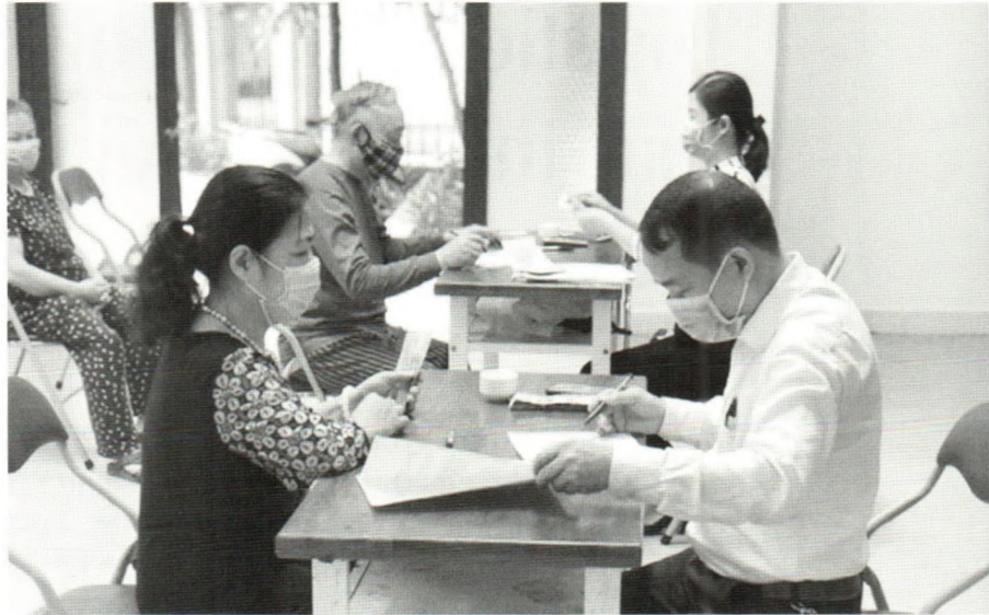
Chi trả tiền hỗ trợ người dân gặp khó khăn do dịch Covid-19

Thứ hai, Chính phủ cần ban hành những chính sách khuyến khích các địa phương thiết lập các kênh thông tin chính thống, chuyên ngành để cập nhật cho doanh nghiệp và người lao động về chiến lược phát triển kinh tế, các chính sách hỗ trợ lao động và thu hút lao động, các kế hoạch về xét nghiệm, kiểm soát bệnh dịch của địa phương giúp họ xây dựng và thực hiện các kế hoạch khôi phục và phát triển sản xuất. Cùng với đó, chính quyền địa phương rà soát lại cung - cầu lao động ở địa phương để phối hợp với trung tâm dịch vụ việc làm tổ chức tư vấn cho người dân đi làm việc tại các doanh nghiệp, cơ sở sản xuất có nhu cầu tuyển dụng trong tỉnh hoặc ở thị trường các tỉnh, thành phố.