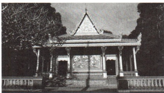
Hình 4: Tiên nữ Keynor đỡ dưới vòm mái Chánh điện chùa Dơi (tỉnh Sóc Trăng)

Kinnari vốn xuất hiện trong thần thoại Bà la môn giáo với vai trò là tiên nữ, có khả năng múa hát say lòng người, mang ý nghĩa cuộc sống hoan lạc, vĩnh hằng có hình dạng con người với đôi cánh chim đằng sau, hai chân đứng sát vào nhau, ngực hơi nhướn về phía trước, thường được gắn vào vị trí tiếp nối giữa phần cột và phần mái của công và chánh điện ngôi chùa Khmer. Nhiều nghiên cứu đã chỉ ra rằng các dáng điệu, tư thế, luật động và của các hình tượng múa gắn gũi với các hình tượng múa trong Bà la môn giáo và với múa cổ điển Ấn Độ [2].