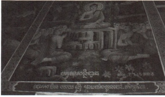
Hình 7: Số tiền được ghi trên tường trong Chánh điện của một ngôi chùa