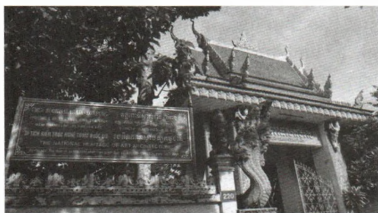
Hình 5: Rắn thần Nagar và đầu thần 4 mặt trên cổng chùa Ông Mệt (tỉnh Trà Vinh)

là từ chung dùng để gọi con vật có hình dạng đầu giống như rắn hổ mang, được hình thành từ hạt bụi vũ trụ, trường sinh bất tử và là vị thần mang lại hạnh phúc cho con người. Rong Neak cũng là biểu tượng của quyền năng và sức mạnh của vũ trụ.