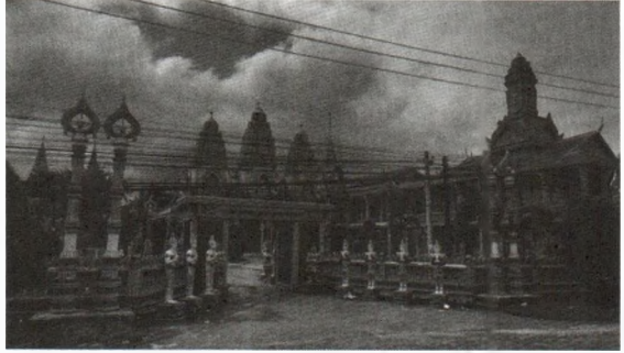
Hình 3: Đầu thần 4 mặt trên nóc nhà thuyết pháp của chùa Tham Chô (Thị xã Vĩnh Châu, tỉnh Sóc Trăng)

lại, ý nghĩa của việc trang trí hình tượng đó trên đỉnh nóc của các công trình nhằm biểu thị Đức Phật đứng ở trục trung tâm vũ trụ, con mắt bao quát cả 4 hướng Đông – Tây – Nam – Bắc [9].