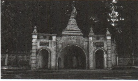
Hình 2: Cổng 5 tháp với tháp cao nhất ở giữa của chùa Hang (tỉnh Trà Vinh)