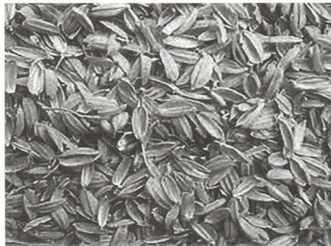
Hình 2. Vỏ trấu

Sản xuất lúa ngoài phát thải KNK gây ảnh hưởng đến sự nóng lên toàn cầu thì nó còn thải ra một lượng lớn phế phụ phẩm trong nông nghiệp như rơm rạ và đặc biệt là vỏ trấu. Theo Tổng cục Thống kê Việt Nam [6], sản lượng lúa của Việt Nam năm 2016 là 43,6 triệu tấn. Kết quả tính toán thực nghiệm cho thấy vỏ trấu chiếm 15% lúa nên chúng ta có thể ước tính lượng trấu sinh ra ở Việt Nam là 6,54 triệu tấn năm -1 . Đây là nguồn sinh khối lớn chúng ta có thể tận dụng, tuy nhiên hiện nay nguồn sinh khối này chúng ta chưa sử dụng hiệu quả hoặc sử dụng không an toàn nên chúng gây ra ô nhiễm môi trường nghiêm trọng.