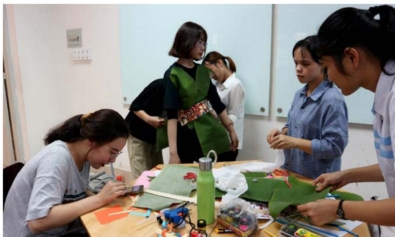
Hình 3. Tổ chức hoạt động dạy học Chủ đề: Thiết kế thời trang

thức đã học để phân tích, tìm hướng giải quyết. Chúng tôi chia làm hai giai đoạn, giai đoạn đầu tiên tập trung vào các kiến thức và nội dung chính của học phần, các nhu cầu cộng đồng được nhắc đến trong các ví dụ theo hướng gợi ý. Ở giai đoạn này, SV tiếp cận với các nhu cầu của cộng đồng thông qua một vài yêu cầu nhỏ liên quan tới nội dung về phương pháp dạy học. Ví dụ, khi giới thiệu một số phương pháp và kỹ thuật dạy học, người thực hiện có thể thiết kế hoạt động với tình huống SV trong vai trò là giáo viên tiểu học ở một khối lớp, “chuẩn bị các tranh, ảnh minh họa cho chủ đề, bài học phù hợp với hoạt động có sử dụng phương pháp trực quan và kỹ thuật dạy học mảnh ghép để giúp HS tìm hiểu đồ họa tranh in”. Ví dụ: Hình 3, với mong muốn giúp HS hình dung về việc tổ chức các hoạt động dạy học, phương pháp và kỹ thuật dạy học, nội dung giáo dục địa phương, giảng viên sẽ thiết kế tổ chức hoạt động để SV tham gia và trải nghiệm dựa trên Chủ đề: “Thiết kế thời trang” với yêu cầu sử dụng nguyên vật liệu tại địa phương (như lá chuối).