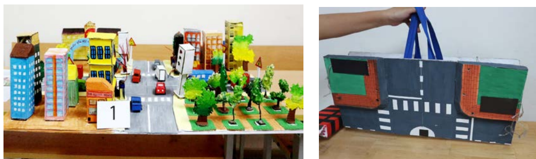
Hình 4. Sản phẩm mô hình hệ thống giao thông để dạy học nhiều chủ đề, khối lớp, nhiều môn học ở bậc Tiểu học

Thông qua việc này, SV không chỉ áp dụng được những kiến thức đã học vào thực tiễn mà còn hình thành những kinh nghiệm, học tập thêm nhiều kiến thức, kỹ năng mềm (giao tiếp, ứng xử...). Từ đây, SV thay đổi quan điểm và tích cực hơn khi tham gia vào các hoạt động HTPVCĐ, một phần vì nhận thức được lợi ích của các hoạt động mà mình tham gia đối với cộng đồng; hơn nữa, SV còn nhận ra các kiến thức, kỹ năng, trải nghiệm mà mình có được thông qua các hoạt động này thực sự hữu dụng và cần thiết.