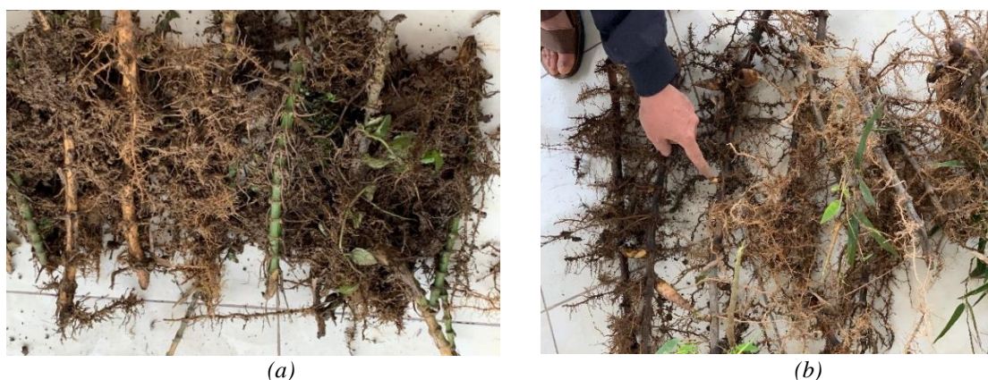
Hình 3. Thân ngầm (roi) (a) ở Bát Xát, Lào Cai và (b) ở Mèo Vạc, Hà Giang