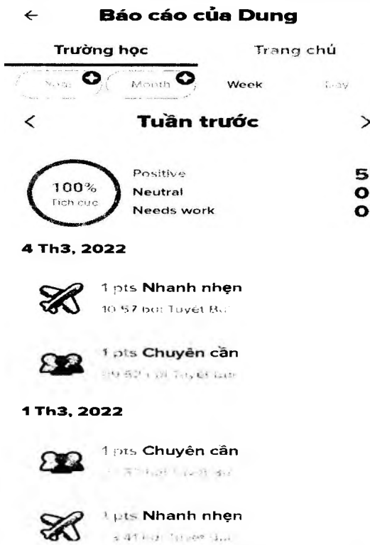
Hình 2.5: Điểm đánh giá của HS trên điện thoại phụ huynh

Bước 4: Quản lý thông tin của con mình qua việc xem các thông báo của nhà trường, các tin tức của lớp hoặc trao đổi GV chủ nhiệm qua mục tin nhắn.