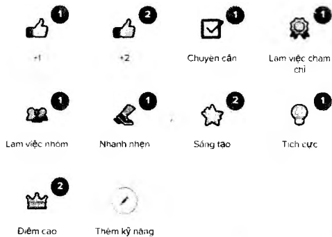
Hình 2.3: Thiết lập các thang điểm cộng và điểm trừ

Bước 9. Các GV có thể chia sẻ lớp học với các GV khác để họ có thể cùng tương tác với HS, phụ huynh trong lớp bằng cách thêm email của các GV.