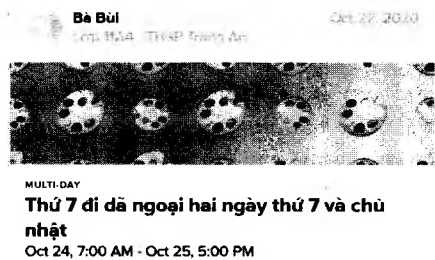
Hình 2.4: Sự kiện được tạo trên bảng tin của ứng dụng