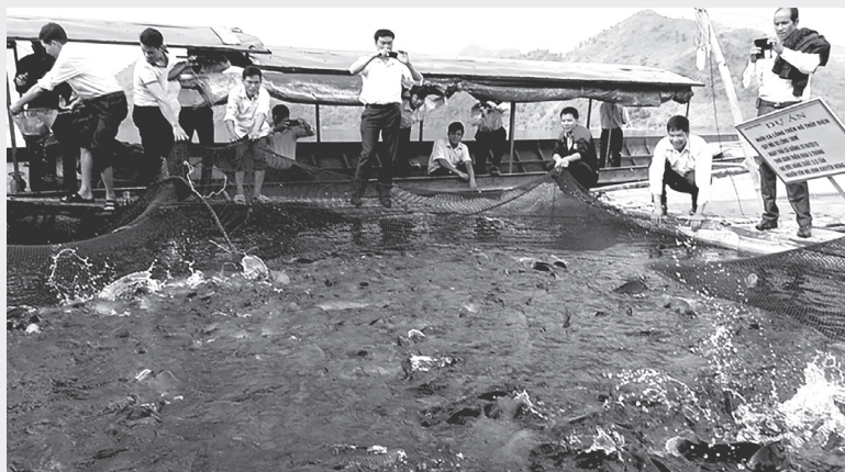
Mô hình nuôi cá lồng trên lồng hồ thủy điện bản Thẩm Phé, xã Mường Kim, huyện Than Uyên, tỉnh Lai Châu