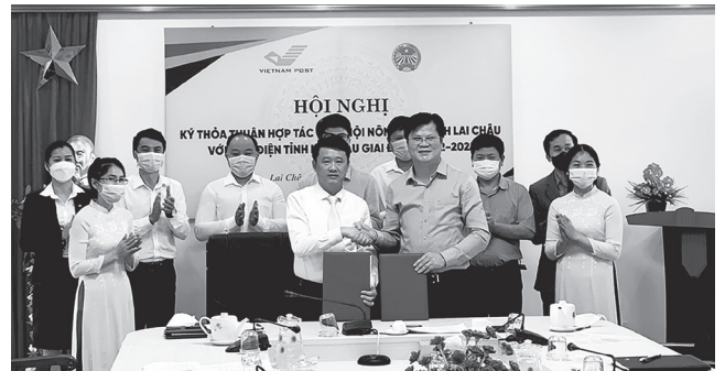
Đại diện lãnh đạo Hội Nông dân tỉnh Lai Châu và Bưu điện tỉnh ký thỏa thuận hợp tác về Hỗ trợ nông dân chuyển đổi số trong sản xuất và tiêu thụ nông sản, hàng hóa giai đoạn 2022 - 2025.

phát triển thương mại điện tử tỉnh Lai Châu năm 2022; Kế hoạch số 453/KH-UBND ngày 18/02/2022 về thực hiện Đề án đẩy mạnh ứng dụng công nghệ thông tin và chuyển đổi số trong hoạt động xúc tiến thương mại giai đoạn 2021-2030 trên địa bàn tỉnh Lai Châu để làm cơ sở hỗ trợ các cơ quan, tổ chức xúc tiến thương mại, các doanh nghiệp, hợp tác xã và hộ kinh doanh ứng dụng công nghệ thông tin và triển khai thương mại điện tử trong hoạt động sản xuất kinh doanh.