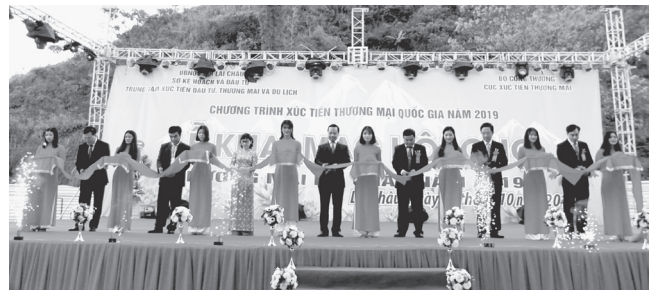
Các đồng chí lãnh đạo tỉnh, thành phố Lai Châu, Cục Xúc tiến thương mại (Bộ Công Thương), sở, ngành tỉnh cắt băng khai mạc Hội chợ thương mại Lai Châu năm 2019