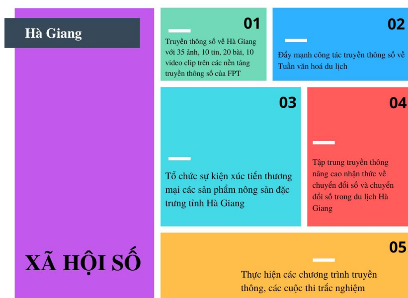
Hình 3. Thực trạng Xã hội số tại Hà Giang

Xã hội số tại Hà Giang chia thành 5 hoạt động; trong đó truyền thông số về Hà Giang tính đến tháng 8/2022 thì Hà Giang với 35 ảnh, 10 tin, 20 bài, 10 video clip trên các nền tảng truyền thông số của FPT; Đẩy mạnh công tác truyền thông số về Tuần văn hóa du lịch; Tổ chức sự kiện xúc tiến thương mại các sản phẩm nông sản đặc trưng tỉnh Hà Giang; Tập trung truyền thông nâng cao nhận thức về CDS và CDS trong du lịch Hà Giang; Thực hiện các chương trình truyền thông, các cuộc thi trắc nghiệm. Mô tả kết quả chi tiết về xã hội số tại Hà Giang như Hình 3.