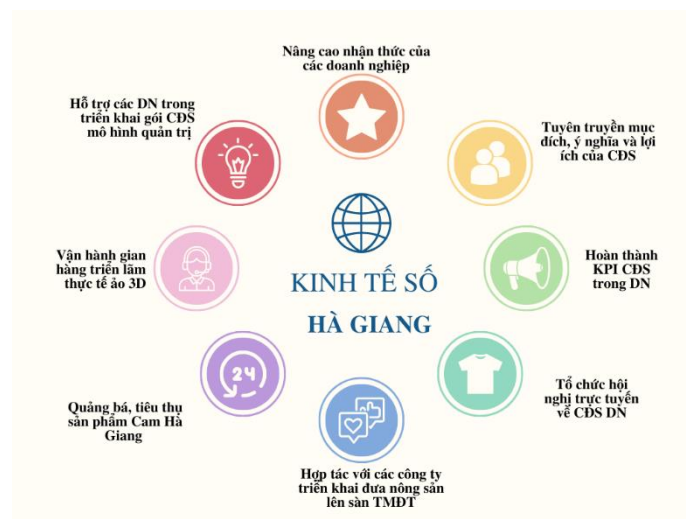
Hình 2. Thực trạng Kinh tế số tại tỉnh Hà Giang

(Nguồn: Báo cáo kết quả triển khai CDS tỉnh Hà Giang năm 2022)