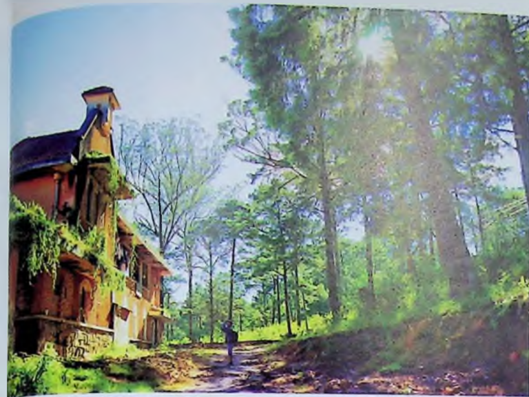
Đà Lạt cổ xưa.