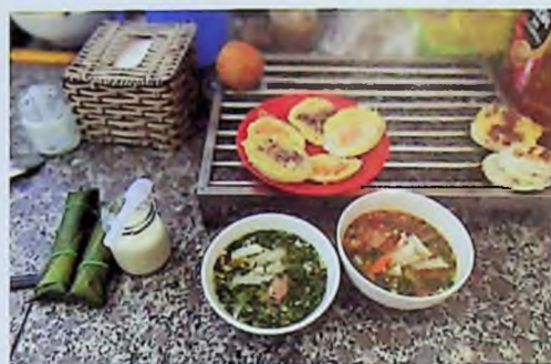
Món bánh căn cổ Hoa Đà Lạt.

Mỗi người sẽ có một cách khác nhau để thưởng ngoạn cảnh sắc Đà Lạt phố. Riêng tôi thích hòa mình cùng thiên