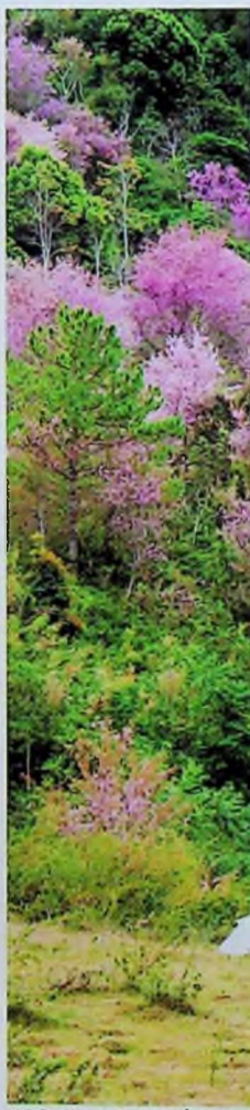
Mai rừng Đà Lạt đón xuân.