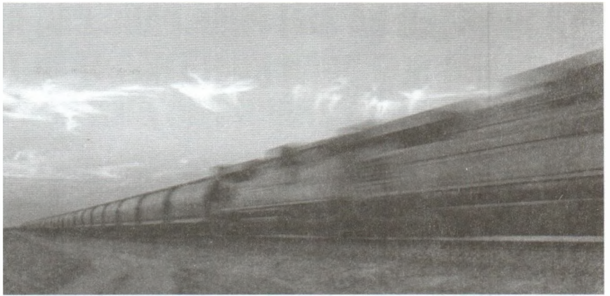
H.06 - Ảnh trên: Mạng lưới đường sắt Etihad Railway dự kiến sẽ vận chuyển hành khách trong những năm tới.

Một yếu tố quan trọng của mạng lưới là Đường sắt Etihad - tuyến đường sắt chở hàng và chở khách trị giá 11 tỷ USD, dài 1.200 km trải dài khắp Các tiểu vương quốc Ả Rập từ Vịnh Oman đến Vịnh Ba Tư. ■