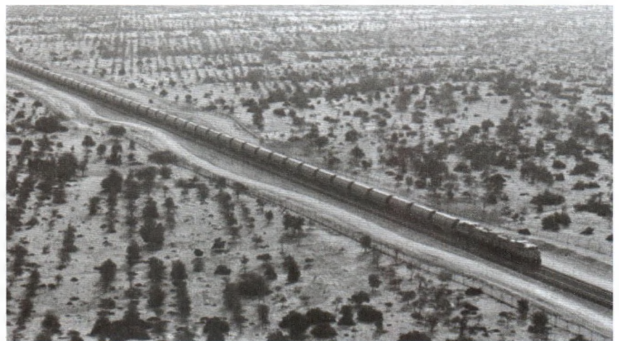
H.05 - Giai đoạn 2 sẽ mở rộng mạng lưới đường sắt Etihad 605 km bắt đầu xây dựng vào năm 2020.

"Tầm nhìn của các nhà lãnh đạo vùng Vịnh đã xuất hiện từ tầm nhìn của tham vọng và đôi khi là tham vọng phi thực tế thành tầm nhìn của chủ nghĩa thực dụng," Giáo sư Amery nói.