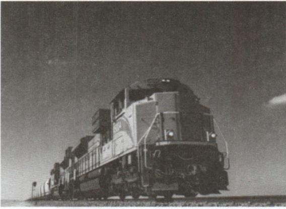
H.03 - Giai đoạn 1, mạng lưới đường sắt 'the Etihad Rail Network' triển khai dịch vụ chở hàng hóa từ năm 2016. Image courtesy of Etihad Rail. (Photo on the Internet)