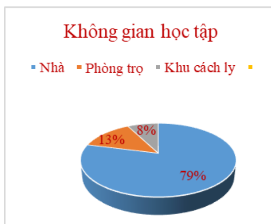
Hình 3. Không gian học tập