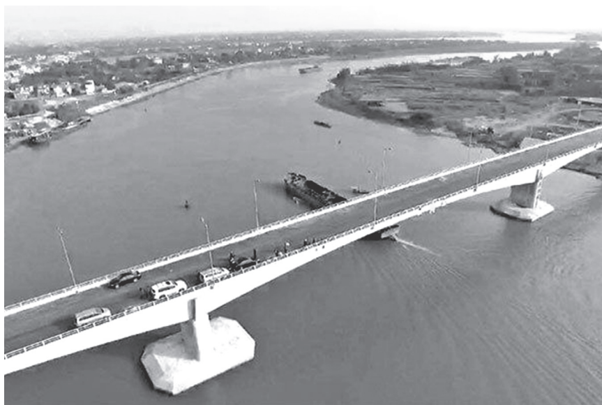
Cầu Tân Phong nằm trên quốc lộ 21B bắc qua sông Đào được đưa vào khai thác giúp rút ngắn 10 km đường di chuyển từ các huyện Nam Trực, Trực Ninh, Xuân Trường, Hải Hậu đi Thái Bình và Hải Phòng