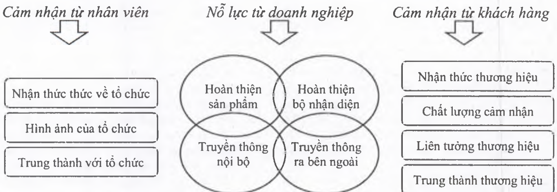
Hình 1: Thương hiệu theo tiếp cận đa chiều

- Chủ thể được trao quyền quản lý CDĐL hầu hết là các cơ quan quản lý nhà nước (như các sở chuyên ngành) hoặc chính quyền địa phương, trong