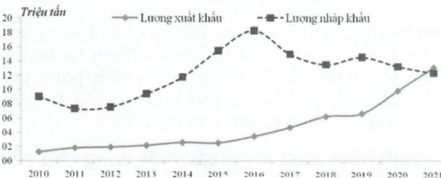
Hình 3: Lượng xuất khẩu và nhập khẩu sắt thép giai đoạn 2011-2021

Xuất khẩu sắt thép các loại lần đầu tiên vượt mốc 10 triệu tấn/năm và trị giá vượt 10 tỷ USD. Lượng sắt thép xuất khẩu năm 2021 đạt hơn 13 triệu tấn, tăng cao tới 32,9%; trị giá đạt 11,79 tỷ USD, tăng 124,3% so với năm 2020. Giá xuất khẩu sắt thép các loại trong năm 2021 tăng 68,8% so với năm trước, tương ứng tăng 367 USD/tấn. Năm 2021 là năm đầu tiên khối lượng xuất khẩu sắt thép các loại cao hơn so với khối lượng nhập khẩu.