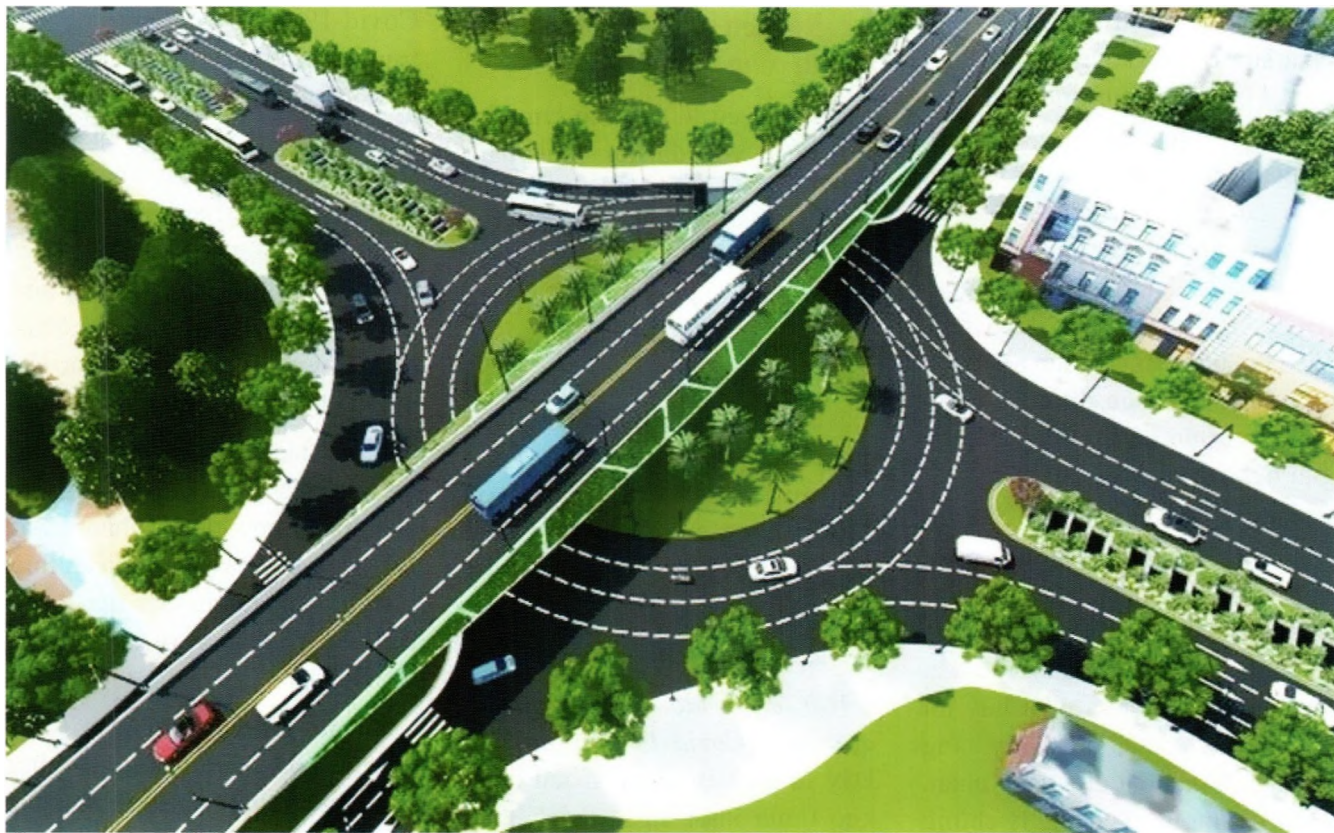
Giải ngân vốn đầu tư công là tiền đề quan trọng để tiếp tục vực dậy kinh tế trong đại dịch

trạng đình đốn nền kinh tế, sản xuất khi lạm phát tăng cao sẽ là vấn đề chung mà thế giới phải đối mặt và Việt Nam, trong bối cảnh còn rất nhiều mặt hàng phụ thuộc nhập khẩu bên ngoài cho cả các dự án hạ tầng cơ sở lẫn sản xuất của khu vực tư doanh cũng sẽ phải ứng phó với tình hình giá cả leo thang. Các dự án, công trình thuộc kế hoạch năm 2022 và giai đoạn 2021 - 2025 sẽ tiếp tục phải gánh chịu những khó khăn về giá cả.