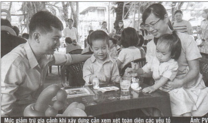
Mức giảm trừ gia cảnh khi xây dựng cần xem xét toàn diện các yếu tố

Tôi cho rằng việc xác định mức giảm trừ gia cảnh cần cân nhắc thận trọng để đảm bảo các mục tiêu trong từng giai đoạn. Theo đó, trong ngắn hạn, tôi cho rằng việc tăng giảm trừ gia cảnh không quá khả thi, vì khi luật thay đổi thì đời