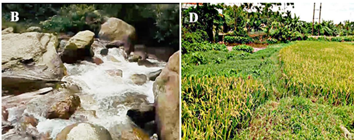
Hình 2: Sinh cảnh sống của cá tại khu vực nghiên cứu