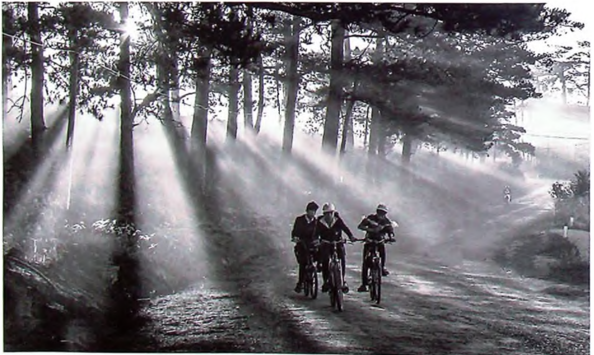
Dà Lạt bình yên.

ĐL nổi tiếng với những kiến trúc cổ kiểu Pháp là những dinh thự, biệt thự với khoảng gần 1000 ngôi biệt thự cổ từ thời Pháp thuộc. ĐL được coi là một “tiểu Pa ri”, một “Bảo tàng kiến trúc châu Âu thế kỷ 20”. Đó là những ngôi biệt thự cổ rong rêu, cổ kính, yên bình, trầm mặc, lặng lẽ dưới rừng thông vi vút, với những kiểu dáng vô cùng đa dạng