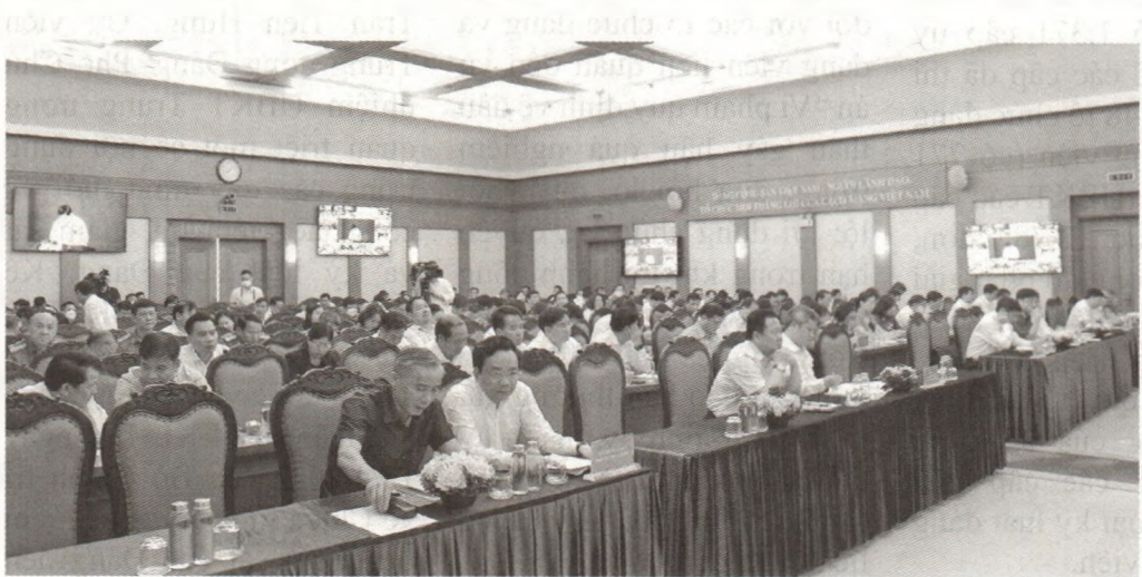
Đại biểu dự Hội nghị tại điểm cầu Cơ quan UBKT Trung ương, Hà Nội.

tra, giám sát, kỷ luật đảng. Tổ chức triển khai thực hiện nghiêm túc, hiệu quả Kết luận số 21-KL/TW, ngày 25/10/2021 của Ban Chấp hành Trung ương về đẩy mạnh xây dựng, chỉnh đốn Đảng và hệ thống chính trị; kiên quyết ngăn chặn, đẩy lùi, xử lý nghiêm cán bộ, đảng viên suy thoái về tư tưởng chính trị, đạo đức, lối sống, biểu hiện “tự diễn biến”, “tự chuyển hoá”; các văn bản, các quy định của Bộ Chính trị; Chiến lược kiểm tra, giám sát của Đảng đến năm 2030; Quy định về kỷ luật tổ chức đảng và đảng viên vi phạm; Kết luận của Ban Bí thư về luân chuyển cán bộ kiểm tra và các kết luận kiểm tra, giám sát của UBKT Trung ương. Thực hiện toàn diện các nhiệm vụ của Điều lệ Đảng; tập trung kiểm tra, xử lý kịp thời, nghiêm minh các tổ chức đảng, đảng viên có vi phạm trong các vụ việc, vụ án thuộc diện Ban Chỉ đạo Trung ương về phòng, chống tham nhũng, tiêu cực theo dõi, chỉ đạo... □