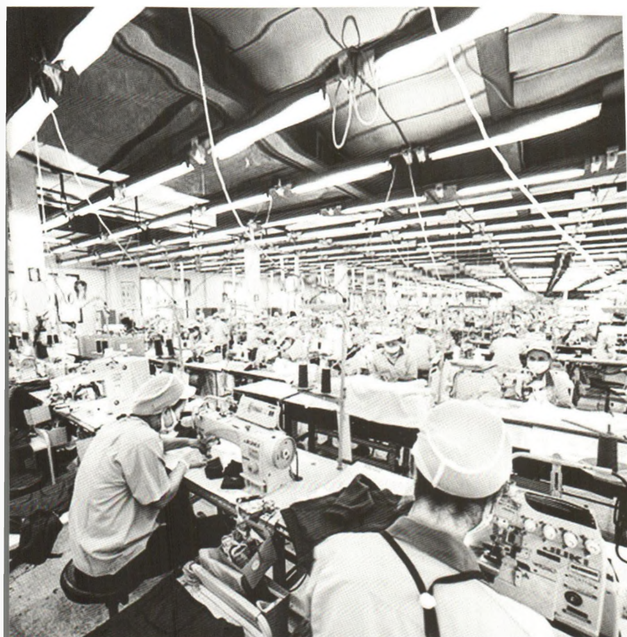
Sản xuất takt time được hiểu là phương pháp sản xuất giúp dây chuyền tạo ra sản phẩm với tốc độ mà khách hàng cần.

chi phí – Một trong những vấn đề lớn của các nhà quản lý đó là lượng sản phẩm được chuẩn bị sớm vượt xa nhu cầu của khách hàng, khi đó, đôi khi phải bán giảm giá để giảm lượng hàng tồn kho. Với Takt Time, nhu cầu của khách hàng sẽ được phản ánh trong lượng sản phẩm mà bạn đang chuẩn bị. Do đó việc sản xuất thừa sẽ gần như không xuất hiện.