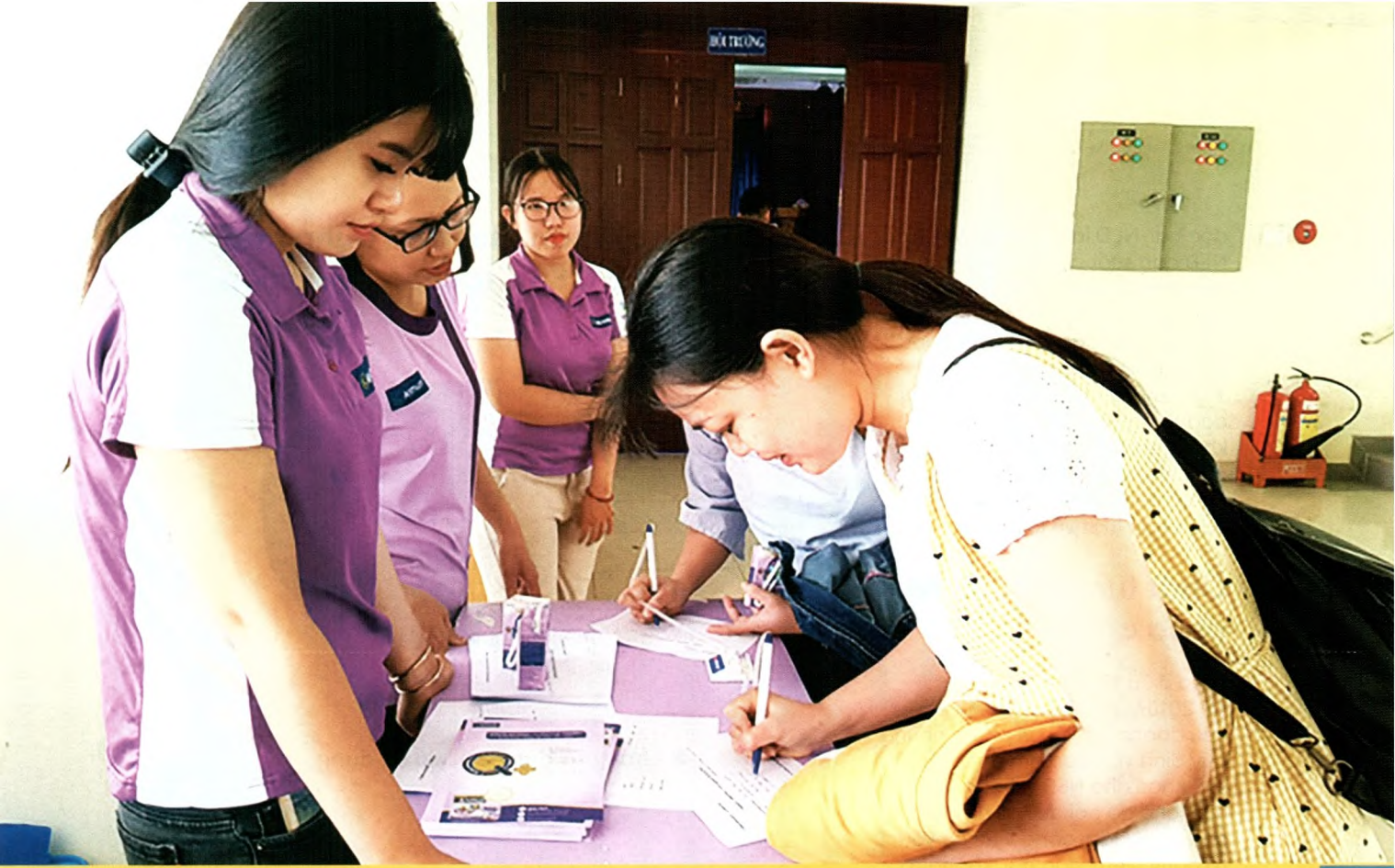
Nữ công nhân đang mang thai đăng ký khám và nghe tư vấn chế độ dinh dưỡng hợp lý trong thai kỳ, tầm soát và tiêm phòng thai kỳ... do Công đoàn Các Khu công nghiệp, Khu chế xuất TP. Hồ Chí Minh tổ chức.

định kỳ. Chẳng hạn, những hoạt động lễ ra cần phải thực hiện với tần suất thường xuyên hơn (sáu tháng một lần đối với hoạt động khám sức khỏe định kỳ ở những ngành nghề nặng nhọc, độc hại, nguy hiểm hay theo tháng hoặc theo quý với những hoạt động như tư vấn sức khỏe cá nhân hay phun thuốc phòng ngừa dịch bệnh), thì có tới 47,5% công nhân cho rằng nơi họ làm việc thực hiện hoạt động tư vấn sức khỏe cá nhân với tần suất một năm một lần; 31,1% nói doanh nghiệp thực hiện hoạt động phòng, chống dịch bệnh một năm một lần; 37,0% ý kiến cho rằng, doanh nghiệp thực hiện hoạt động khám sức khỏe định kỳ cho công nhân một năm một lần.