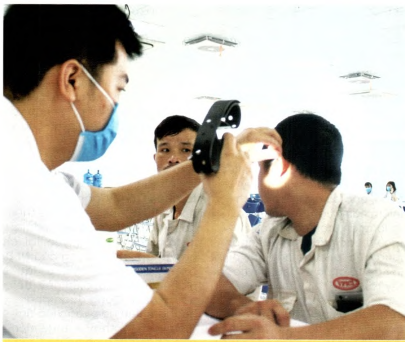
Công ty VPIC1 (Vĩnh Yên-Vĩnh Phúc) tổ chức khám sức khỏe định kỳ cho công nhân, người lao động trong công ty.

CHĂM SÓC SỨC KHỎE (CSSK) CHO NLĐ LÀ NGHĨA VỤ, TRÁCH NHIỆM CỦA DOANH NGHIỆP. QUYẾT ĐỊNH SỐ 659/QĐ-TTĐ, NGÀY 20/5/2020 CỦA THỦ TƯỚNG CHÍNH PHỦ PHÊ DUYỆT CHƯƠNG TRÌNH CHĂM SÓC VÀ NÂNG CAO SỨC KHỎE NLĐ, PHÒNG CHỐNG BỆNH NGHỀ NGHIỆP (BNN) GIAI ĐOẠN 2020 - 2030 NÊU RÕ: "BẢO VỆ, CHĂM SÓC VÀ NÂNG CAO SỨC KHỎE NLĐ LÀ ĐẦU TƯ CHO SỰ PHÁT TRIỂN CỦA QUỐC GIA; LÀ NGHĨA VỤ, TRÁCH NHIỆM CỦA MỖI NLĐ, NGƯỜI SỬ DỤNG LAO ĐỘNG (NSDLĐ)..., NSDLĐ CÓ TRÁCH NHIỆM THỰC THI ĐẦY ĐỦ QUY ĐỊNH VỀ ATVSLĐ THEO QUY ĐỊNH CỦA PHÁP LUẬT". BÀI VIẾT DƯỚI ĐÂY LÀ KẾT QUẢ VIỆC KHẢO SÁT TRÊN 1.200 CÔNG NHÂN VỀ CÔNG TÁC CSSK CỦA DOANH NGHIỆP CHO CÔNG NHÂN TẠI CÁC KCN TRÊN ĐỊA BÀN TP. HÀ NỘI, QUẢNG NGÃI, ĐỒNG NAI VÀ TP. CẦN THƠ.