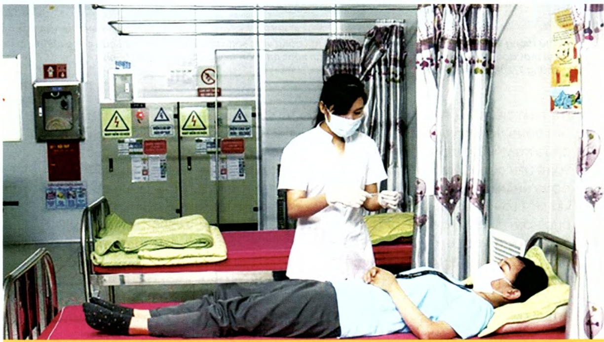
Phòng Y tế của Công ty TNHH Namuga Phú Thọ như một “Trạm Y tế thu nhỏ”, được đầu tư trang bị cơ sở vật chất và thiết bị y tế đầy đủ, đảm bảo công tác chăm sóc sức khỏe cho người lao động.

Thứ tư , cần nghiên cứu hoàn thiện thêm các quy định pháp luật, hướng dẫn thực hiện việc khám sức khỏe nghề nghiệp tại các doanh nghiệp hiện nay. □