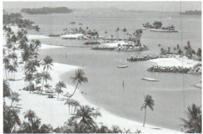
Hình 3. Bờ biển (trên) và bãi biển du lịch Singapore.

quốc gia nghèo về kinh tế nhưng rất giàu, rất phong phú về các di sản phi vật thể đã và đang được xem cách tiếp cận cộng đồng trên đây là một trong những cách tiếp cận hay, hiệu quả thiết thực. Đồng thời, việc giữ gìn và phát huy các giá trị vật thể và phi vật thể vào cuộc sống cũng là một cách tiếp cận có hiệu quả không những chỉ cho công cuộc phát triển du lịch mà còn góp phần không nhỏ trong công cuộc phát triển kinh tế xã hội nói chung./