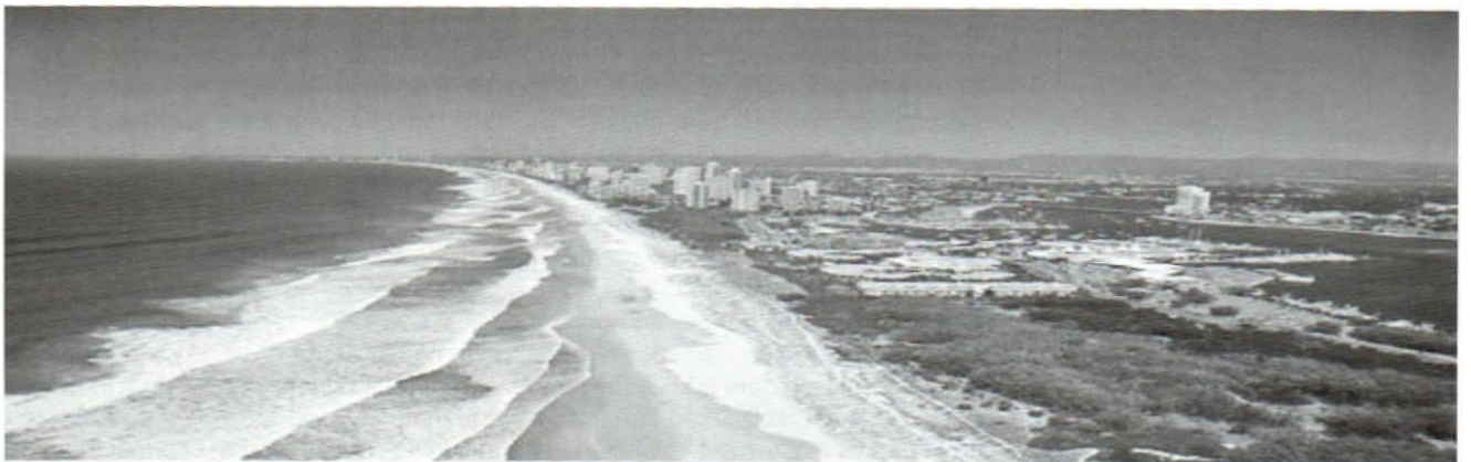
Hình 2. Một bãi biển Vàng (Gold Coast) ở Bang Queen-Land, Bắc Australia.

- Tại Singapore, Bộ trưởng cấp cao Goh-Chok-Tong đã đánh giá "Toàn bộ ý tưởng của Trung Quốc sẽ được nhân rộng ở Singapore. Và rằng, "Chính phủ Singapore sẽ xem xét để xây dựng và phát triển nhiều dự án sinh thái như Thiên Tân". Điều này, ngày nay đã trở thành hiện thực trên khắp "đào quốc" xinh đẹp vào bậc nhất, nhì trên thế giới.