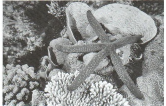
Hình 1. Kangaroo và sinh vật dưới lòng đại dương Australia.

đông nam Australia. Theo quy hoạch của thành phố, các biện pháp Brisbane sẽ thực hiện là theo mô hình của một "Thành phố thông minh", triệt để sử dụng năng lượng "xanh" để bảo vệ môi trường sinh thái. Đó là: