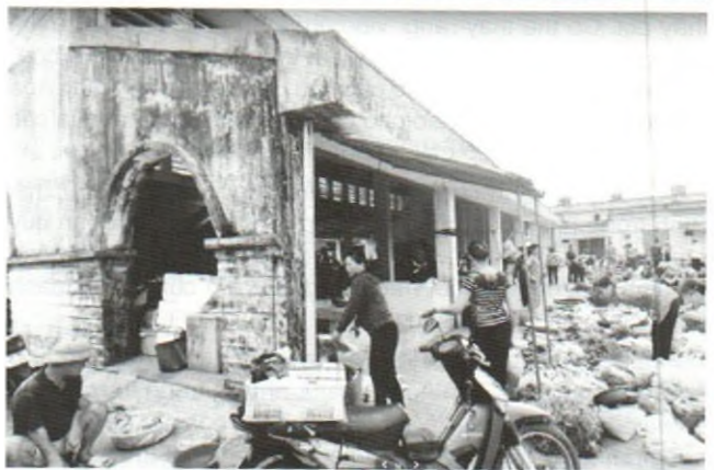
Hình 2. Chợ hải sản Cửa Lân (Tiền Hải)

lưới chợ, cơ bản thừa nhận mạng lưới sẵn có tại địa bàn, rà soát loại bỏ các chợ hoạt động không đúng chức năng, ví dụ: chợ đầu mối hải sản Đông Minh (Tiền Hải) được chuyển đổi công năng do hoạt động thực tế là bán đồ gia dụng (Hình 1), chợ Tây (Thái Thụy) được quy hoạch xây mới (chợ hạng 1). [1]