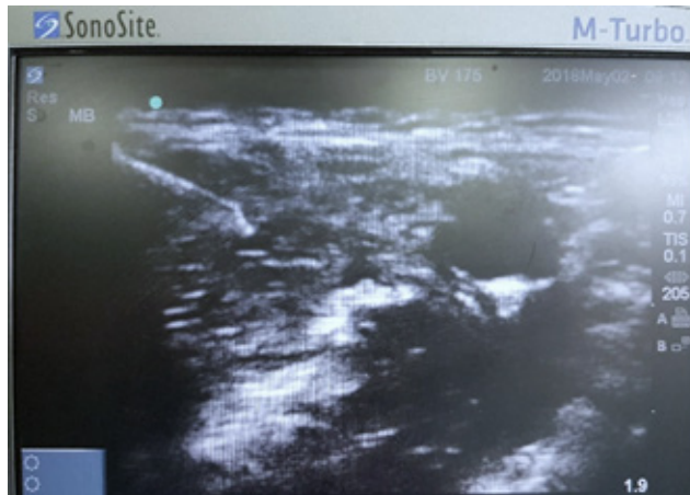
Hình 5. Hình ảnh gây tê TK cơ bì