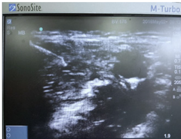
Hình 3&4: Hình ảnh gây tê ĐRTK cánh tay đường nách dưới siêu âm

Lùi kim 1-2cm, đi kim hướng về bờ trên của động mạch nách, vị trí 12 giờ (hướng kim về thần kinh giữa), tiến hành hút ngược bơm tiêm, nếu không có máu