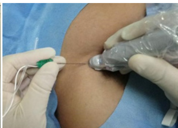
Hình 2 Kỹ thuật đi kim gây tê ĐRTK đường nách dưới hướng dẫn SA

Dưới hướng dẫn siêu âm, sau khi tê tại chỗ bằng lidocaine 2% 1ml, đi kim gây tê trong bình diện siêu âm vào đám rối thần kinh. Đi kim hướng về bờ dưới của động mạch nách, vị trí 6 giờ (hướng kim về thần kinh quay), tiến hành hút ngược