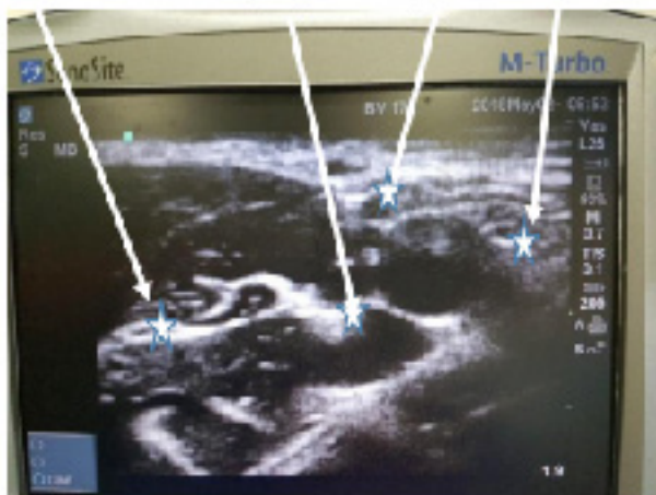
Hình 1. Hình mốc dây TK trên SA