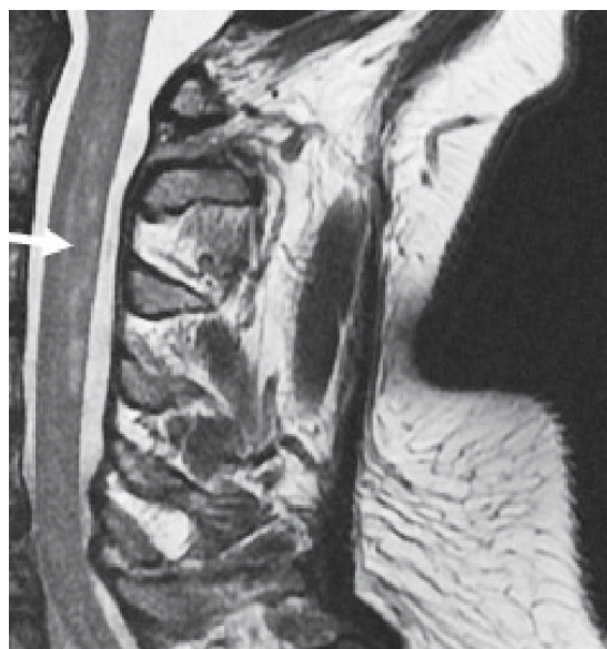
Hình 3: Tổn thương tủy sống do bóng khí giống hội chứng Brown-Sequard xác định bằng hình ảnh MRI (trích từ tài liệu tham khảo [10])

Chẩn đoán DCS dựa vào khai thác bệnh sử và khám lâm sàng, không có xét nghiệm cận lâm sàng đặc hiệu để chẩn đoán xác định. Bệnh sử cần chú ý thời gian lặn, độ sâu và các phương tiện bảo hộ đi kèm. Khám lâm sàng cần tỉ mỉ và toàn diện, tránh bỏ sót tổn thương, đánh giá đúng phân loại để có tiên lượng bệnh nhân phù hợp. Các xét nghiệm cận lâm sàng có ý