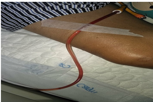
Dẫn lưu niệu đạo ngày thứ 1

Bác sĩ cho chỉ định rút thông dẫn lưu bàng quang ra da đồng thời đặt thông tiểu lưu niệu đạo.