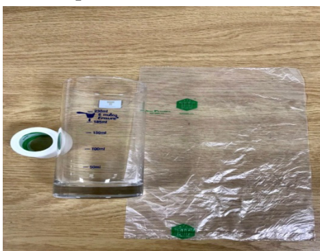
Dụng cụ lấy nước tiểu niệu đạo

da túi nước tiểu van 1 chiều tháng 1 lần và khi dơ.