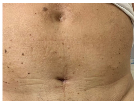
Rút thông bàng quang trên xương mu.

Những người bệnh đột quy não có biểu hiện bất thường chức năng đường tiết niệu dưới, không thể tránh khỏi việc sử dụng các ống thông bàng quang. Nhiều nghiên cứu cho thấy LUTS không chỉ liên