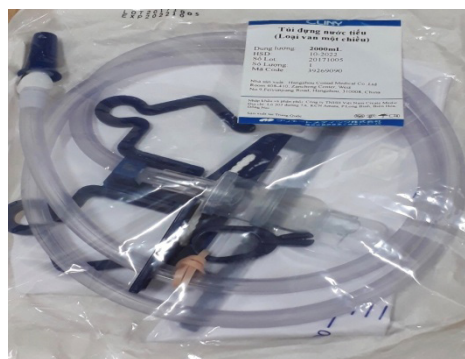
Túi nước tiểu van 1 chiều

Thực hiện chỉ định đo niệu động học lần 2 tại bệnh viện Bình Dân.