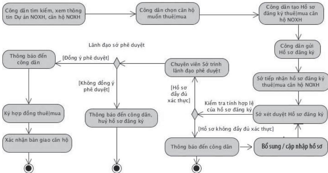
Hình 3. Quy trình đăng ký và xét duyệt hồ sơ đăng ký mua căn hộ NOXH