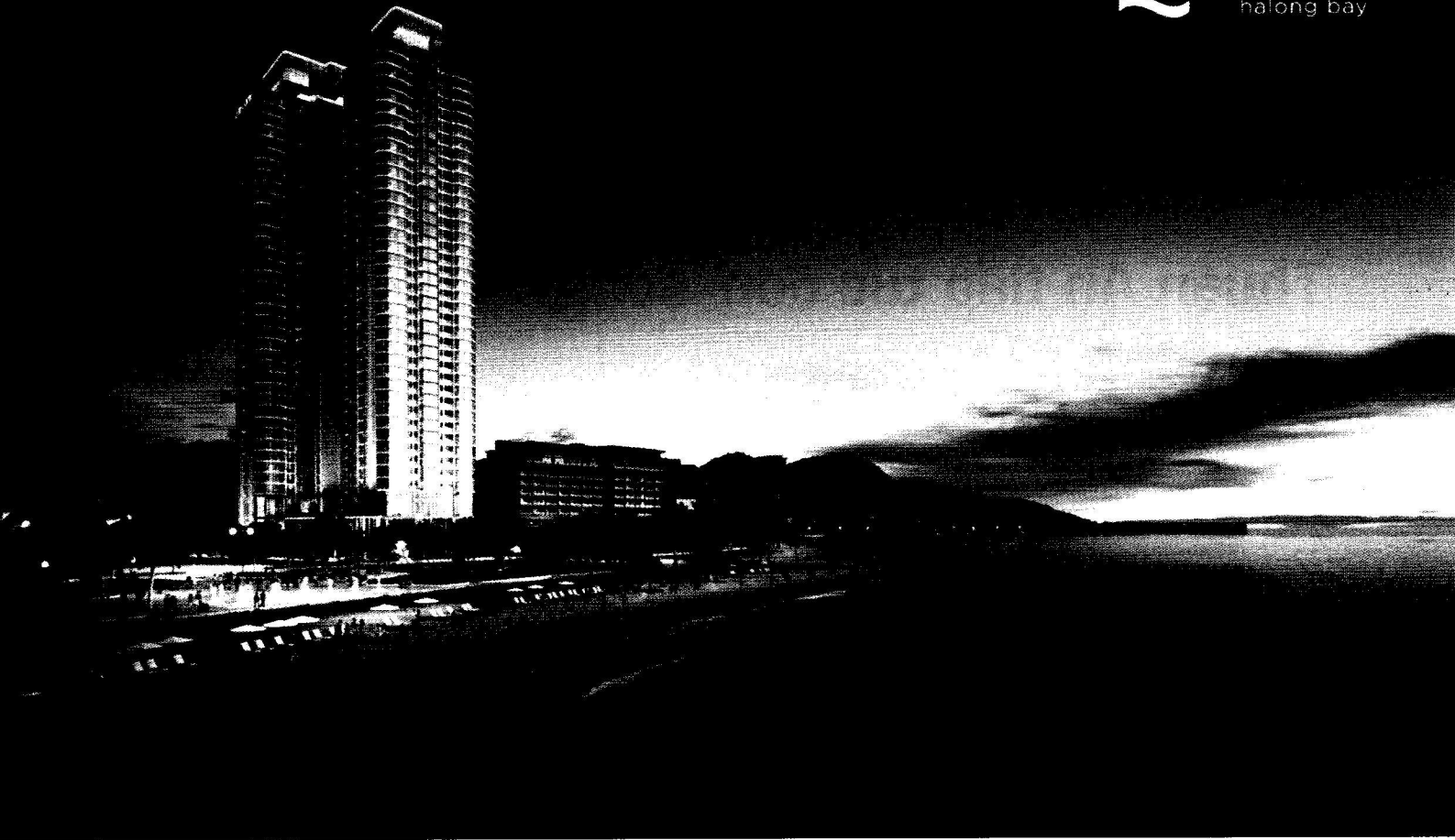
Ảnh: À La Carte Halong Bay - được phát triển bởi TASECO Land