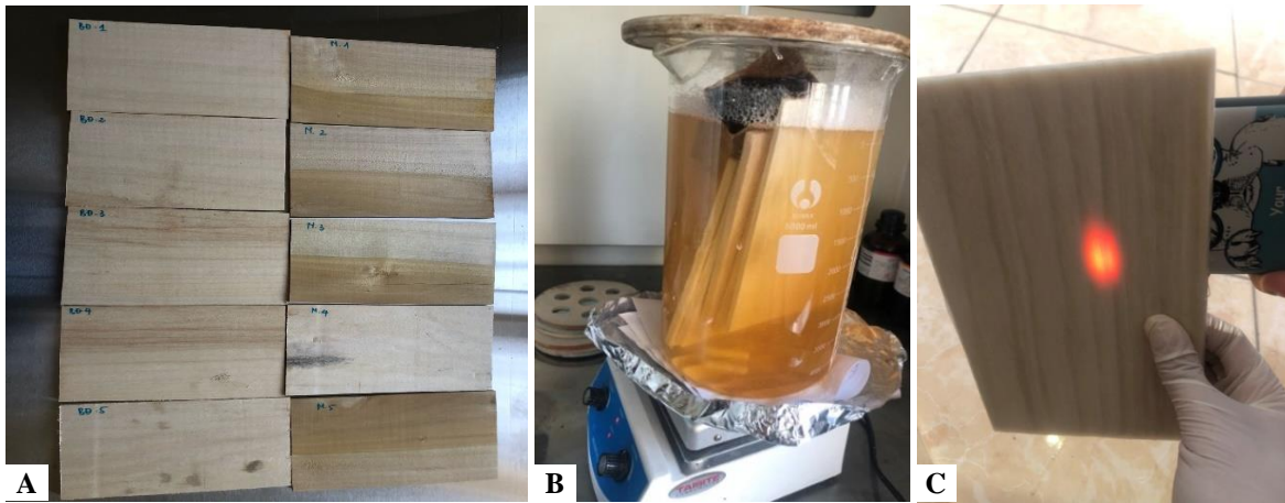
Hình 1. Một số hình ảnh mẫu thí nghiệm A. Mẫu gỗ Mỡ và gỗ Bồ đề; B. Tẩy trắng mẫu thí nghiệm; C. Hiện tượng thấu quang của gỗ sau khi tẩy trắng

máy khuấy từ có gia nhiệt khuấy đều dung dịch. Sau khi nhiệt độ dung dịch đạt 45°C, đưa mẫu thí nghiệm gỗ Mỡ và Bồ đề vào trong cốc thủy tinh, mẫu gỗ được ngập trong dung dịch (hình 1B). Thí nghiệm tiến hành xử lý trong 6h, sau khi xử lý được lấy ra rửa sạch, sấy khô, quá trình xử lý lặp lại 3 lần, trong suốt quá trình xử lý, mỗi cách 30ph kiểm tra nhiệt độ của dung dịch và duy trì ở nhiệt độ ở 45°C. Quan sát hiện tượng sau khi tẩy trắng, gỗ có khả năng thấu quang như hình 1C, tiến hành kiểm tra độ sáng và tỷ lệ lignin của mẫu thí nghiệm.