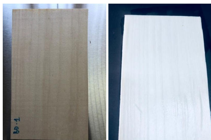
Hình 3. Gỗ Bồ đề trước và sau khi tẩy trắng