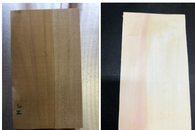
Hình 2. Gỗ Mỡ trước và sau khi tẩy trắng