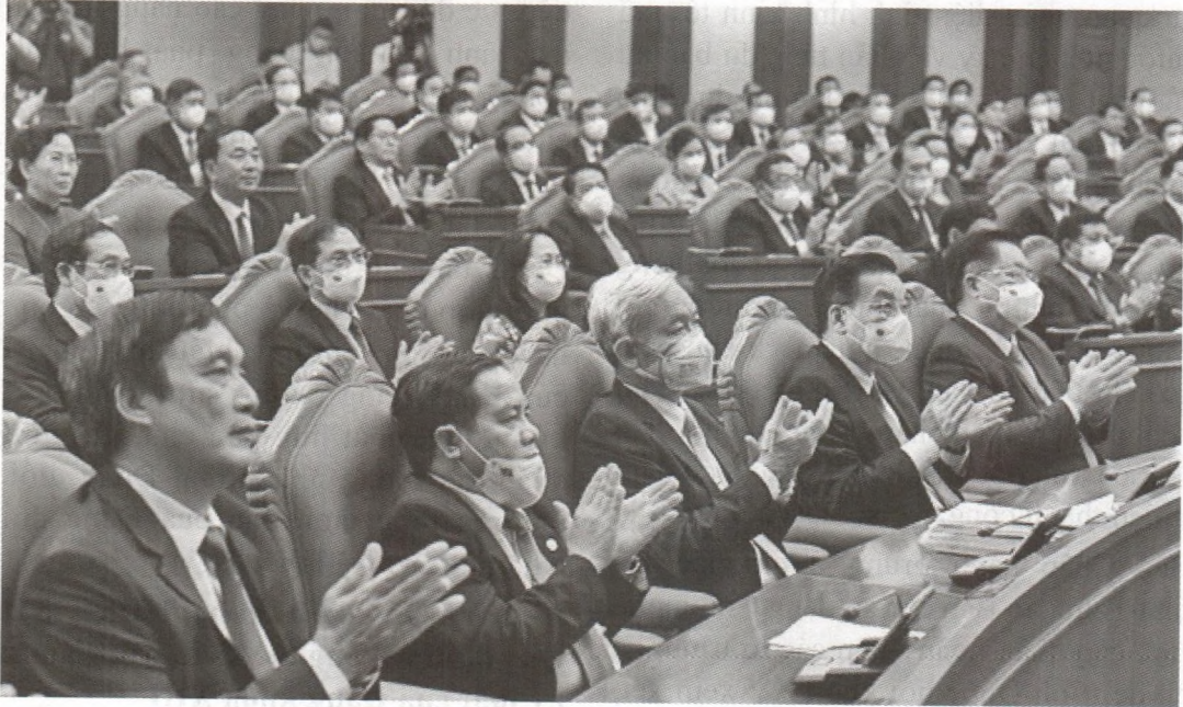
Hội nghị lần thứ 3, Ban Chấp hành Trung ương Đảng khóa XIII thành công tốt đẹp sau 4 ngày làm việc.

thuộc phương pháp, quy trình thủ tục và nghiệp vụ của công tác Đảng cần phải được tổ chức nghiên cứu, quán triệt và triển khai thực hiện nghiêm túc.