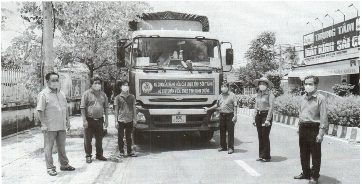
Xe chuyển hàng hóa của Liên đoàn Lao động tỉnh Sóc Trăng hỗ trợ đoàn viên, người lao động tỉnh Bình Dương.

Làn sóng dịch bùng phát từ cuối tháng 4 đến nay tiếp tục tác động mạnh mẽ tới CNVCLĐ. Theo thống kê chưa đầy đủ, hiện