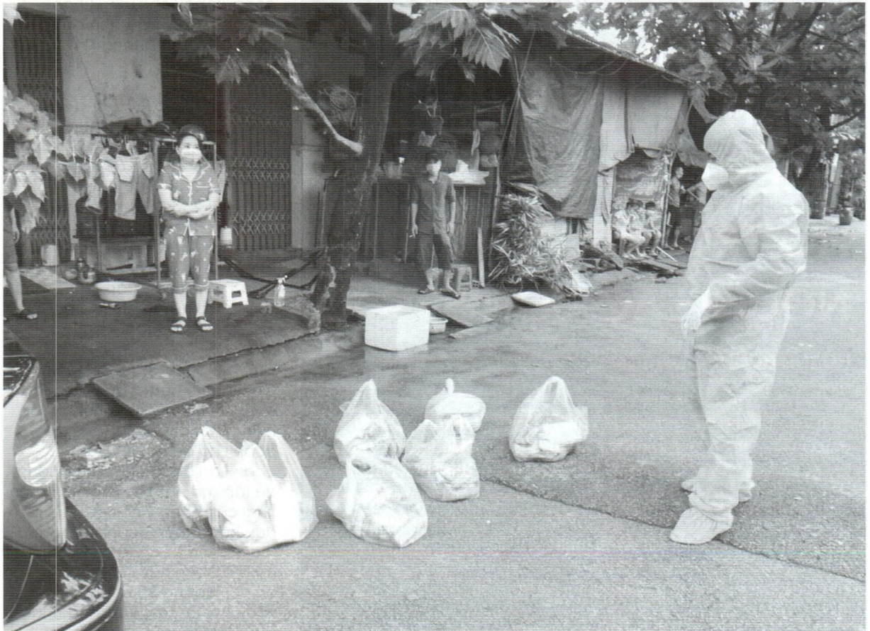
Cán bộ công đoàn Bình Dương hỗ trợ nhu yếu phẩm cho người lao động.

Các đoàn xe chở đầy rau, củ, quả từ các tỉnh chuyển đến Bình Dương được cán bộ công đoàn, tình nguyện viên, ngay trong đêm tiếp nhận và phân loại. Mỗi người một việc, bốc xếp hàng hóa rồi chia từng