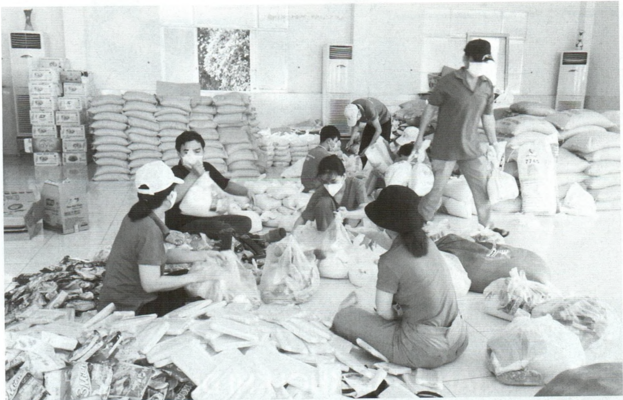
Cán bộ công đoàn tiếp nhận hỗ trợ, phân chia và mang nhu yếu phẩm đến tận nơi cho người lao động.

phần đưa lên xe di chuyển đến người dân khu vực bị phong tỏa. Công việc liên tục như thế, đã nhiều tuần nay họ không có ngày nghỉ, giấc ngủ chập chờn.