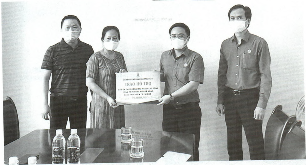
Liên đoàn Lao động quận Hải Châu (TP. Đà Nẵng) trao hỗ trợ bữa ăn cho đoàn viên, người lao động Công ty TNHH MTV In tổng hợp Đà Nẵng thực hiện "3 tại chỗ".

hiện giãn cách theo Chỉ thị 16/CT-TTg trong đợt bùng phát dịch lần thứ 4 từ ngày 27/4/2021 với mức 1 triệu đồng/người; Quyết định sửa đổi bổ sung đối tượng được chi hỗ trợ khẩn cấp đoàn viên, NLĐ khu vực có quan hệ lao động; Quyết định bổ sung đối tượng miễn đóng đoàn phí công đoàn là đoàn viên công đoàn tại các đơn vị sự nghiệp, doanh nghiệp có mức lương thấp hơn mức lương tối thiểu vùng.