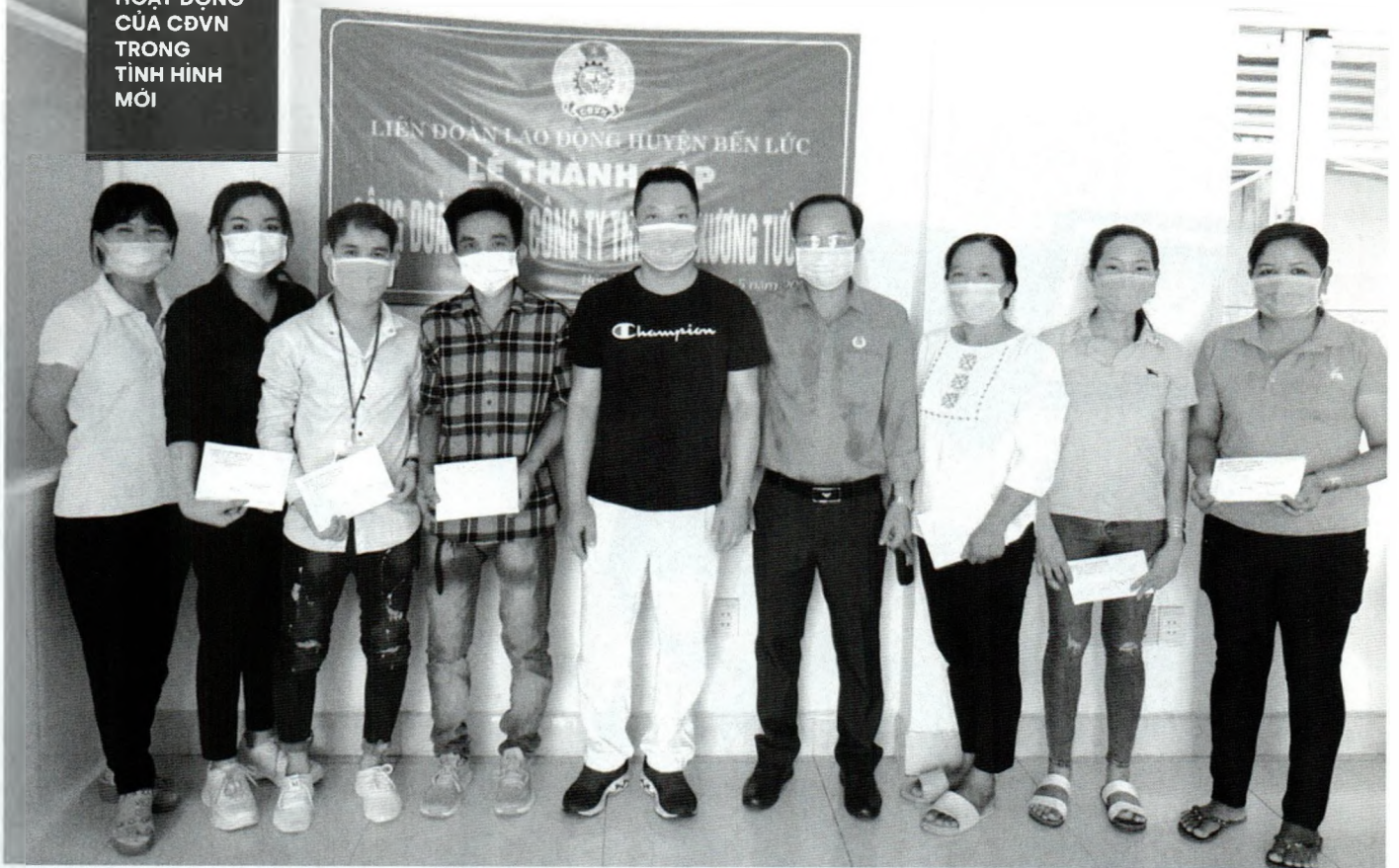
LĐLD huyện Bến Lức (Long An) tổ chức Lễ thành lập công đoàn cơ sở, kết nạp đoàn viên và ra mắt Ban Chấp hành lâm thời Công đoàn cơ sở Công ty TNHH TM Xương Tường.