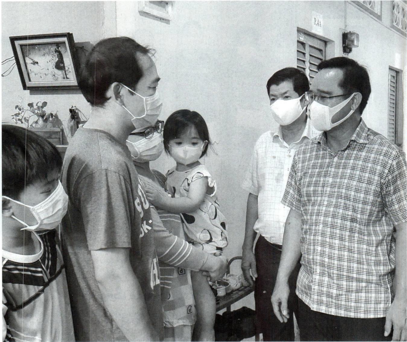
Lãnh đạo Tỉnh ủy và LĐLĐ tỉnh Long An thăm khu nhà trọ công nhân.

công đoàn còn bất cập; nhiều nơi thiếu cán bộ chuyên trách, một bộ phận cán bộ năng lực yếu....". Đối chiếu hạn chế này với tình hình thực tế tại Long An, cho thấy có nguyên nhân là do bất cập về công tác cán bộ.