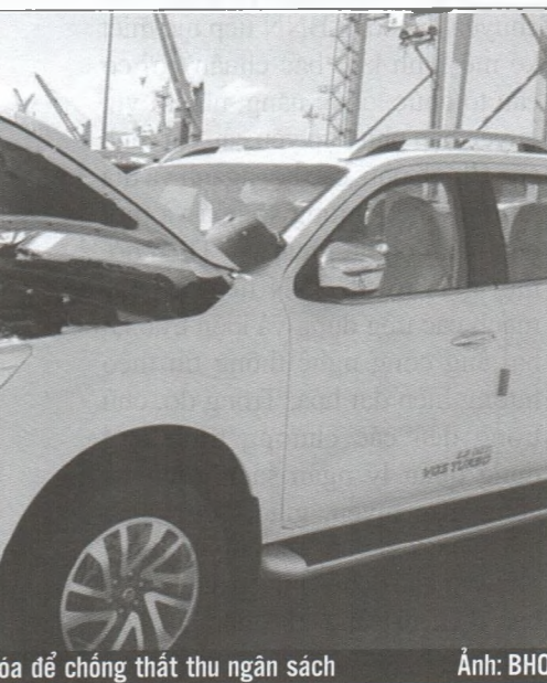
Biện pháp để chống thất thu ngân sách

Xác định rõ khó khăn, thuận lợi của những tháng đầu năm, tại hội nghị giao ban trực tuyến sơ kết quý I/2021, Tổng cục Hải quan đã quán triệt các đơn vị trong toàn ngành tiếp tục đẩy mạnh thực hiện các giải pháp tạo thuận lợi thương mại, nâng cao hiệu quả quản lý nhà nước, chống thất thu NSNN theo Chi thị 215/CT-TCHQ; đẩy mạnh công tác chống thất thu ngân sách theo Công văn số 119/TCHQ-GSQL về tăng cường hoạt động kiểm tra, kiểm soát hàng hóa xuất nhập khẩu, kiểm soát chặt chẽ việc kê khai, xác định trị giá, áp dụng mã số phân loại hàng hóa đối với hàng hóa xuất nhập khẩu. Đồng thời, Tổng cục Hải quan tiếp tục nghiên cứu, rà soát để trình Bộ Tài chính, Chính phủ sửa đổi, bổ sung, thay thế một số văn bản pháp luật theo hướng tạo thuận lợi thương mại, đáp ứng yêu cầu quản lý, tăng cường hợp tác quốc tế, cũng như phối hợp hiệu quả với các cơ quan chức năng ■ HB