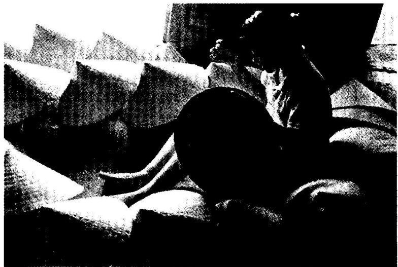
Nghề làm nón lá ở làng Tây Hồ, huyện Phú Vang.

Điểm nổi bật là, UBKT các cấp cùng với làm tốt công tác tham mưu, đã tổ chức thực hiện toàn diện các nhiệm vụ theo quy định Điều lệ Đảng; chú trọng thực hiện nhiệm vụ trọng tâm, kiểm tra tổ chức đảng và đảng viên khi có dấu hiệu vi phạm. Đặc biệt sau khi có Đề án số 04 và Đề án số 07-ĐA/UBKTTU của UBKT Tỉnh ủy Thừa Thiên Huế về “Nâng cao hiệu lực, hiệu quả công tác kiểm tra tổ chức đảng và đảng viên khi có dấu hiệu vi phạm trên địa bàn tỉnh Thừa Thiên Huế trong thời gian tới, trước