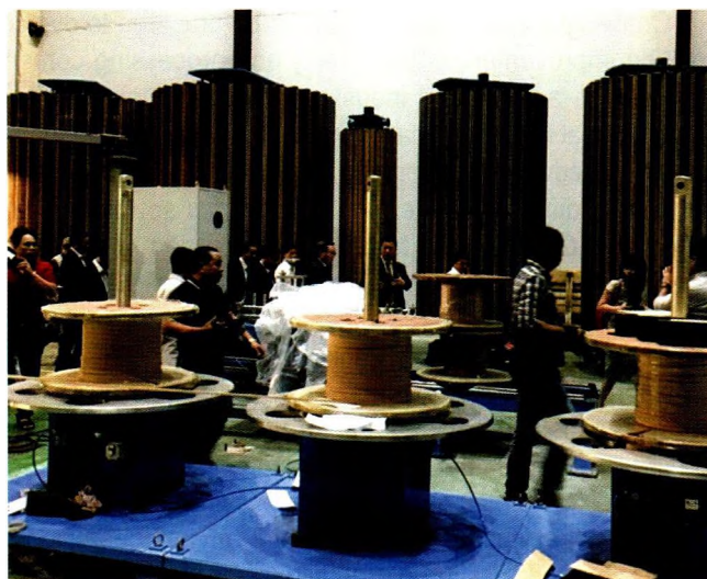
Xưởng quấn dây của Hanaka

Điều kỳ vọng nhất của doanh nghiệp khi tham gia vào CNHT là nhận được sự hỗ trợ về công nghệ, kỹ thuật và