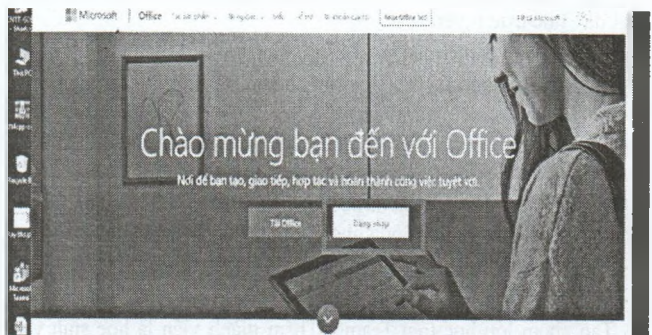
Hình 2: Màn hình đăng nhập Office 365 online

Đăng nhập vào địa chỉ: www.office.com , xuất hiện màn hình. Chọn Đăng nhập