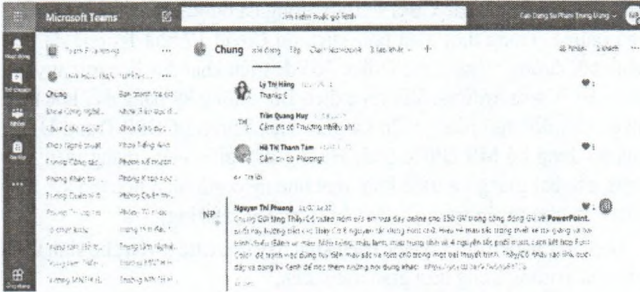
Hình 4: Giao diện MS Teams Dạy học trực tuyến của CBGV Trường CĐSP Trung Ương