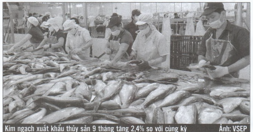
Kim ngạch xuất khẩu thủy sản 9 tháng tăng 2,4% so với cùng kỳ