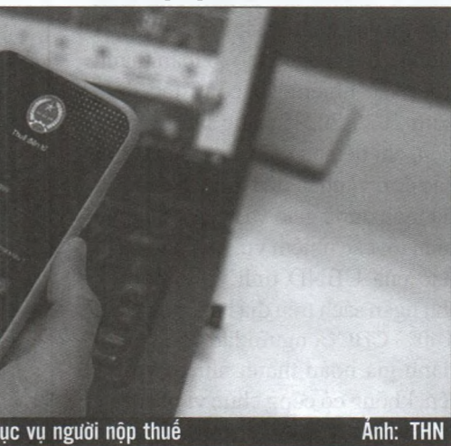
ục vụ người nộp thuế

Với tất cả những nỗ lực nêu trên, có thể khẳng định Cục Thuế Hà Nội là một trong những đơn vị tích cực xây dựng, hoàn thiện và nâng cao hiệu quả của ứng dụng công nghệ thông tin trong công tác chuyển đổi số. Qua đó, thể hiện ý chí, quyết tâm của tập thể Ban Lãnh đạo và cán bộ công chức Cục Thuế trong việc tiến tới nền hành chính minh bạch, hiệu quả, phục vụ DN và người nộp thuế. Từ đó, thu hút sự đồng tình, ủng hộ để người nộp thuế trở thành đối tác đồng hành, thụ hưởng kết quả cụ thể của quá trình chuyển đổi số trong ngành thuế ■