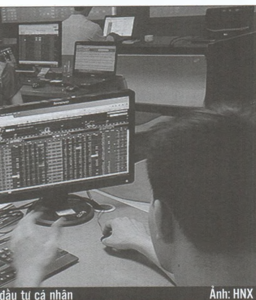
đầu tư cá nhân