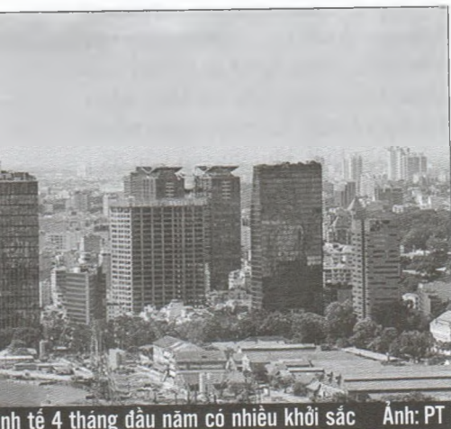
kinh tế 4 tháng đầu năm có nhiều khởi sắc

Về chỉ số giá tiêu dùng (CPI), Tổng cục Thống kê cho biết, tháng 4/2021 giảm 0,04% so với tháng trước, tăng 1,27% so với tháng 12 và tăng 2,7% so với cùng kỳ năm trước. Bình quân 4 tháng, CPI tăng 0,89% so với cùng kỳ năm trước, là mức tăng thấp nhất kể từ năm 2016; lạm phát cơ bản 4 tháng tăng 0,74% ■